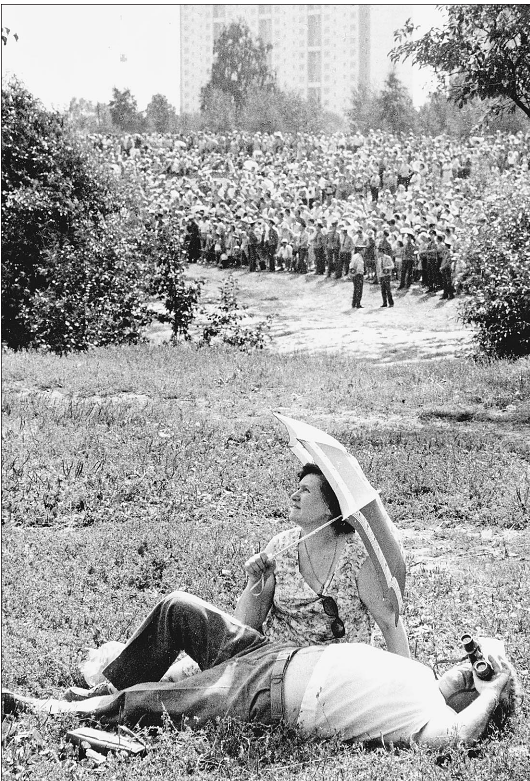
Что там, на солнце?

Климатические катаклизмы приведут к глобальному потеплению