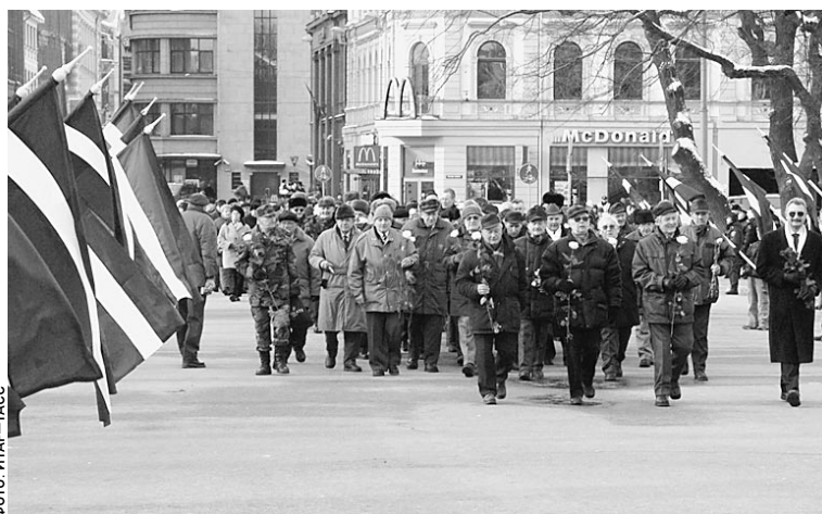
Шествие по улицам Риги в память латышского легиона «Ваффен СС» продолжалось не более получаса