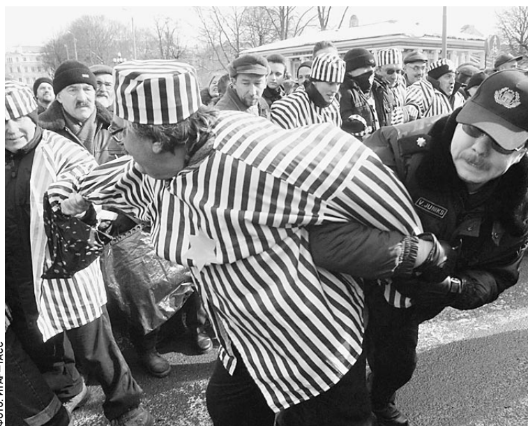
Участники антифашистской акции утверждают, что их арестовали только за то, что они были одеты как узники концлагерей

«Нет фашизму!», «Фашизм не пройдет!» — скандировали люди, одетые как узники концлагерей со звездами Давида на рукавах. Они перегородили дорогу участникам «шествия легионеров». Полиция попыталась отсечь «живую цепь» еще до того, как националисты и ветераны приблизились к пикету, но не успела. Завязалась потасовка. В результате силам правопорядка все же удалось отсечь протестующих. Шествие продолжилось. Дойдя до памятника Свободе, участники марша возложили к нему цветы и провели митинг. Дорога (всего около километра) от Музея оккупации до па-