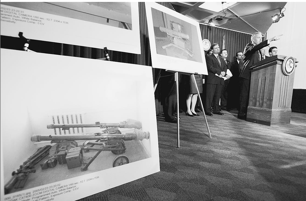
Окружной прокурор Манхэттена Дэвид Келли демонстрирует образцы оружия, которым торговали задержанные...

Во вторник прокуратура Нью-Йорка сообщила об аресте 18 человек, которых подозревают в контрабанде оружия из России. По словам окружного прокурора Манхэттена Дэвида Келли, они занимались незаконной продажей в США переносных ракетных комплексов класса «земля-воздух», гранатометов и другого стрелкового оружия. Прокурор нью-йоркского района Манхэттен Дэвид Келли назвал имена некоторых арестованных — они оказались выходцами из бывшего СССР.