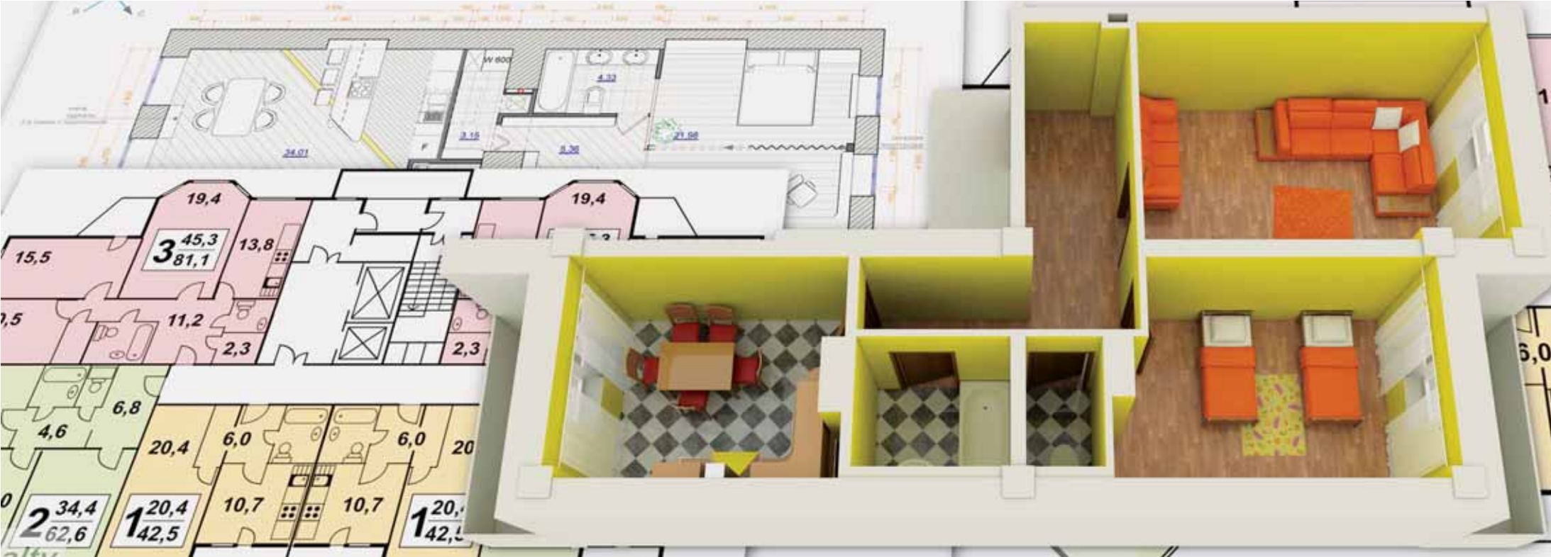
Коллаж Андрея СЕДИХ

государственных жилищных сертификатов по указанному основанию обусловлено необходимостью отселения граждан из закрытых военных городков.