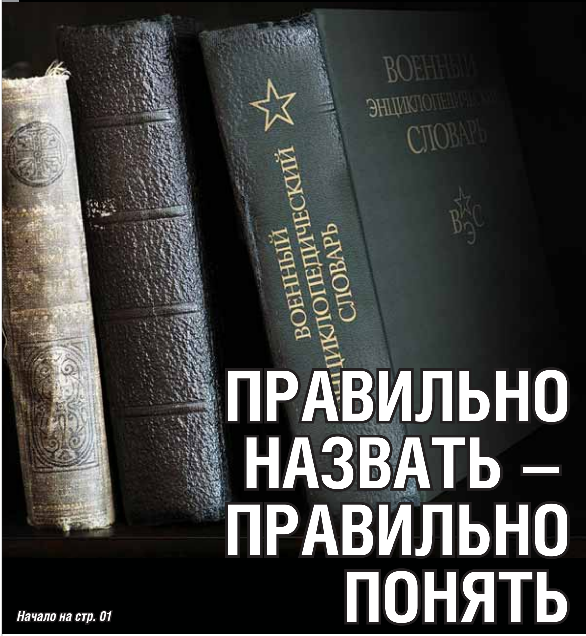
Начало на стр. 01