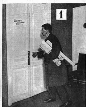
ДВЕРИ ДОЛЖНЫ РАСПЯХИВАТЬСЯ!

Первый номер журнала «ИЗОБРЕТАТЕЛЬ» открывает статья Альберта Эйнштейна «Массы вместо единиц», где великий ученый говорит, что время гениальных изобретателей-одиночек прошло, наступает замечательная эпоха коллективного изобретательства. В этой январской книжке новорожденного издания блистательный подбор авторов. Со статьями выступают крупные государственные и партийные деятели — В.Куйбышев, Л.Каменев, замечательные писатели — М.Пришвин, В.Шкловский, Н.Погодин, знаменитый журналист М.Кольцов, академики, выдающиеся инженеры и простые рабочие. Печатается бюллетень важнейших государственных решений по изобретательским делам, в том числе о привилегиях, помогавших тогдашним изобретателям жить и заниматься творчеством.