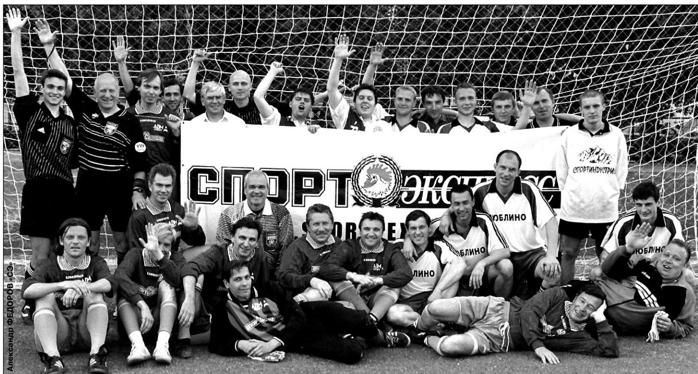
Вчера. Москва. Стадион «Труд». Фото на память после окончания товарищеского матча «СЭ» - сборная ТДК.

«СЭ» выражает искреннюю благодарность спонсорам ТДК — компаниям Nike, Schick (в лице эксклюзивного дистрибьютора, фирмы «Темдэ Лтд.»), «Диалог-Конверсия», Worto-Sport, «Олимпик-Спорт», «Спорт-экип», Магах и фирме Лишбергова (образовательное и обучающее видео). Надеемся, что все они и впредь останутся партнерами нашего дворового футбольного турнира.