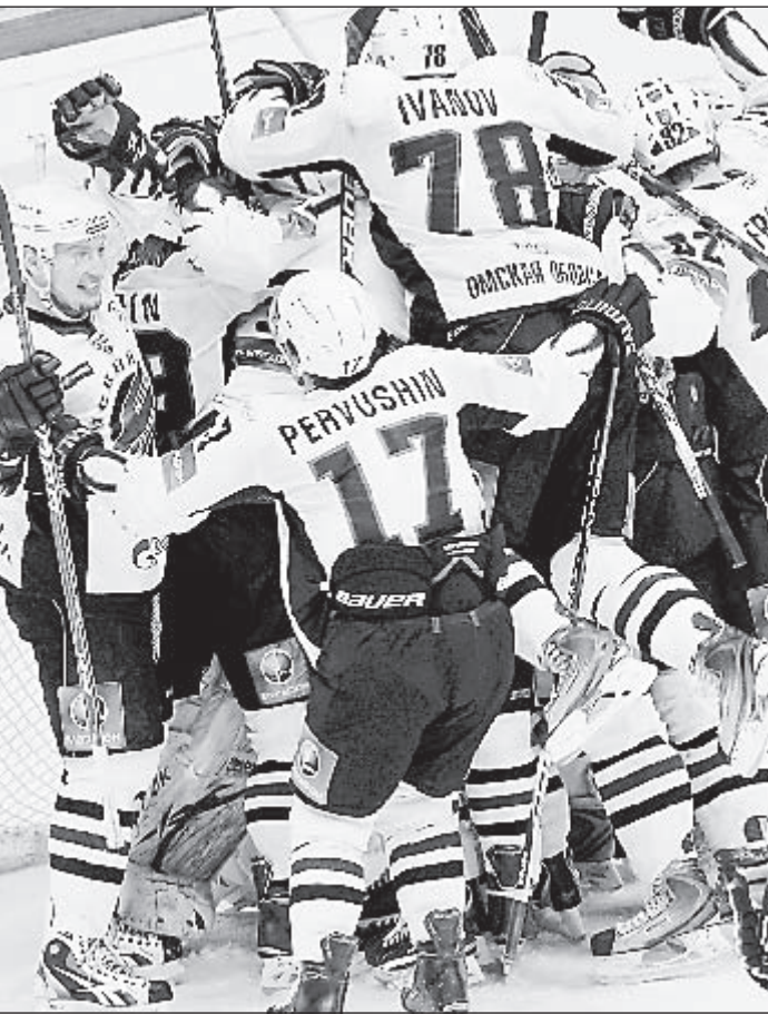
Вчера. Челябинск. «Трактор» - «Авангард» - 0:1. Хоккеисты «Авангарда» празднуют выход в финал Кубка Гагарина.