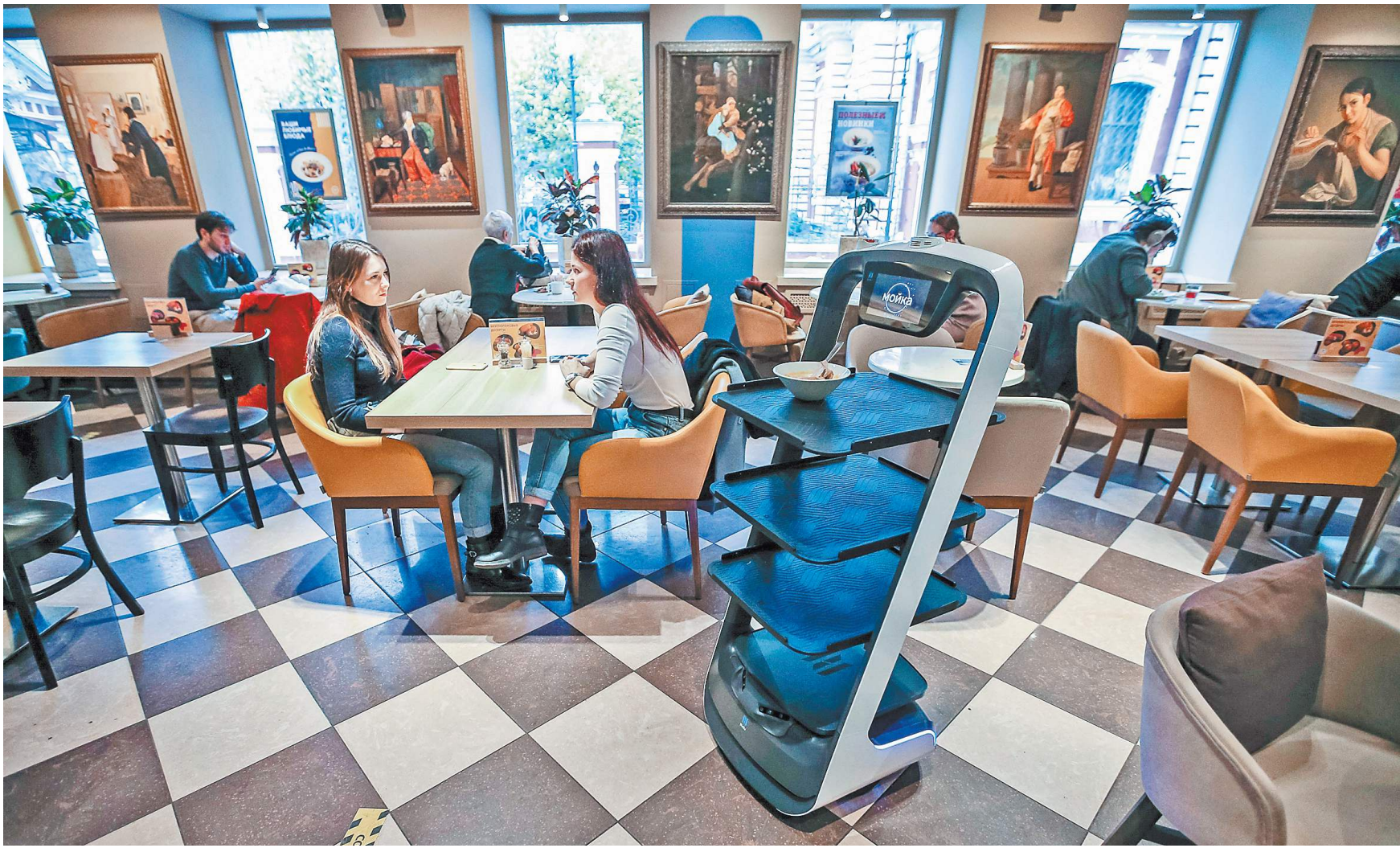
Малые технологические компании сотрудничают с широким спектром заказчиков — от электростанций до аэропортов.