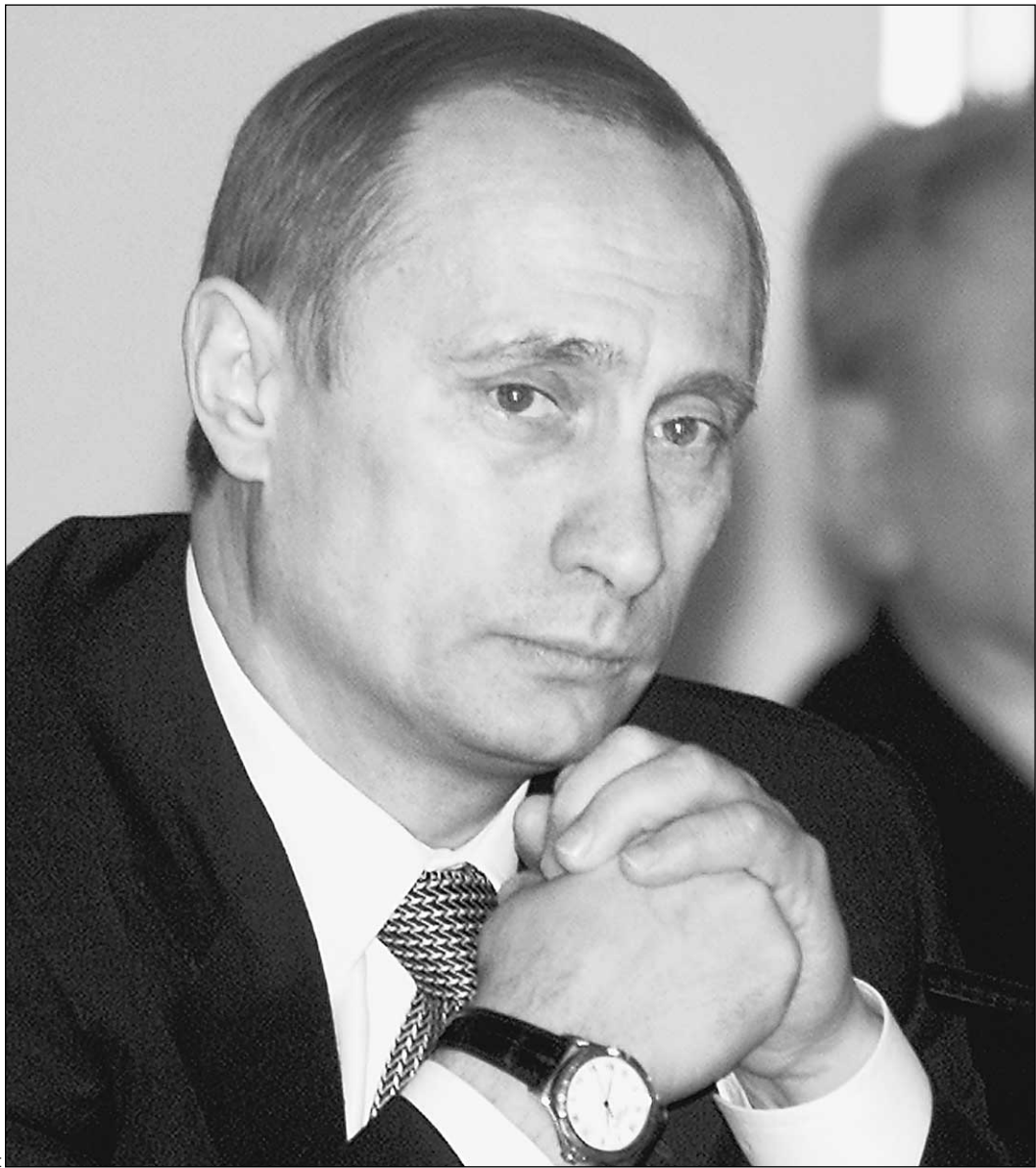
Владимир Путин: два года одиночества

Сегодня два года, как Владимир Путин победил на досрочных президентских выборах. Ельцин ушел, спокойно оставив страну малоизвестному человеку с нехаризматической внешностью из «органов». Человек мгновенно стал популярным. От Путина избиратели не ждали и не требовали программы. Достаточно было, что он — другой. Молодой. Энергичный. Не из «семьи». За прошедшие два года в этом смысле почти ничего не изменилось. Путин остается столь же популярен, ему верят и по-прежнему ничего конкретного не требуют. За Путиным сразу закрепился имидж активного президента. Имидж остался в окреп. Подробности страну почти не интересуют. Это хорошо с точки зрения политической стабильности. Но сомнительно в том смысле, что вся инициатива негласно, но добровольно вверена обществу в руки одного человека. Пусть, мол, он нам сделает красиво. Он честно пытается.