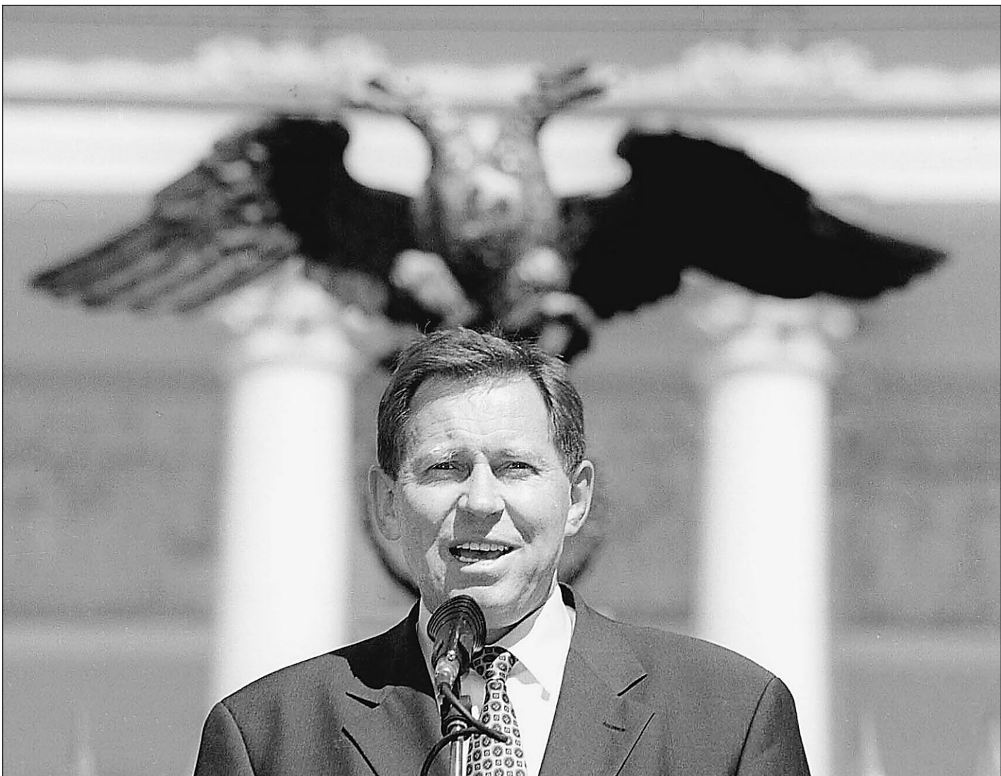
Губернаторы под защитой державы