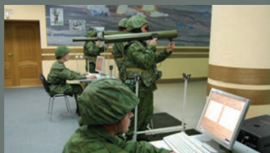
«НОВЫЕ» ПОДХОДЫ К СТАРЫМ МЕТОДИКАМ