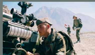
РЕШАЮЩЕЕ УСЛОВИЕ ПОБЕДЫ