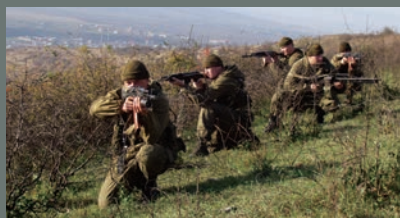
ДЕСАНТ В ГОРАХ