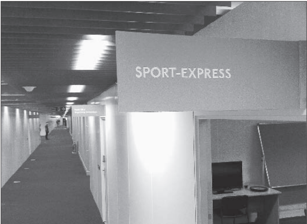
Вчера. Лондон. Пройдет несколько дней, и в коридорах главного пресс-центра Олимпиады станет многолюдно и шумно. Как и в офисе «СЭ», который вчера начала обживать передовая группа репортеров нашей газеты.

Другие материалы о предстоящей Олимпиаде - стр. 11 - 16