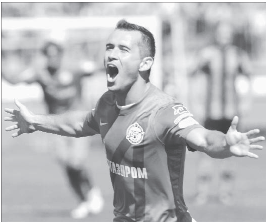
Вчера. Санкт-Петербург. Стадион «Петровский». «Зенит» - «Амкар» - 2:0. 37-я минута. Только что Александр КЕРЖАКОВ открыл счет в матче.

Ну, наконец, прорвало! Форвард, который так и не смог забить во время Евро-2012, вчера на «Петровском» оформил дубль.