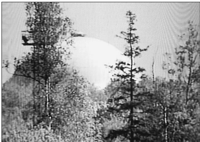
Поселок Курилово. Здесь горел центральный командный пункт российской системы предупреждения о ракетном нападении