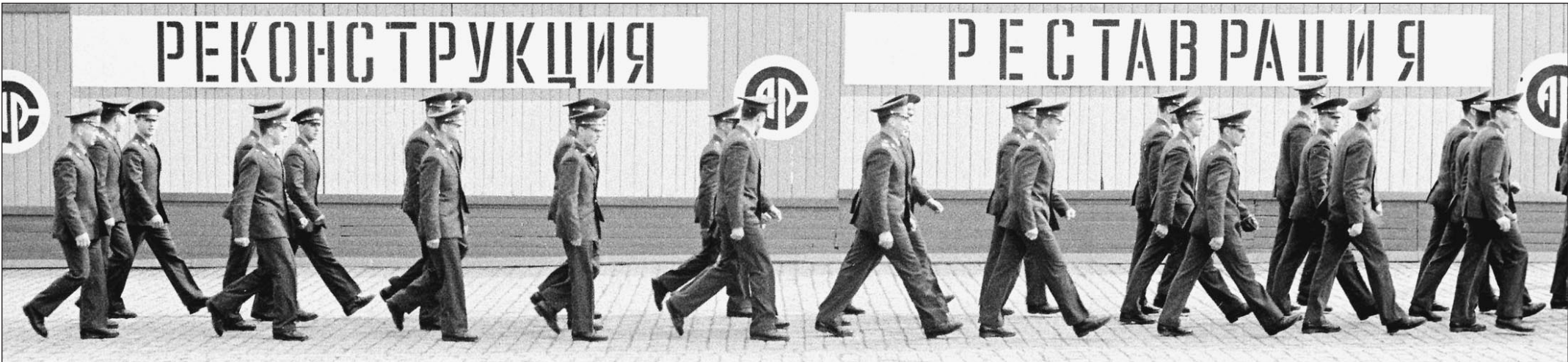
Сгорит? Потушим! Сломается? Построим!

В стране едва не сгорела система обнаружения спутников-шпионов