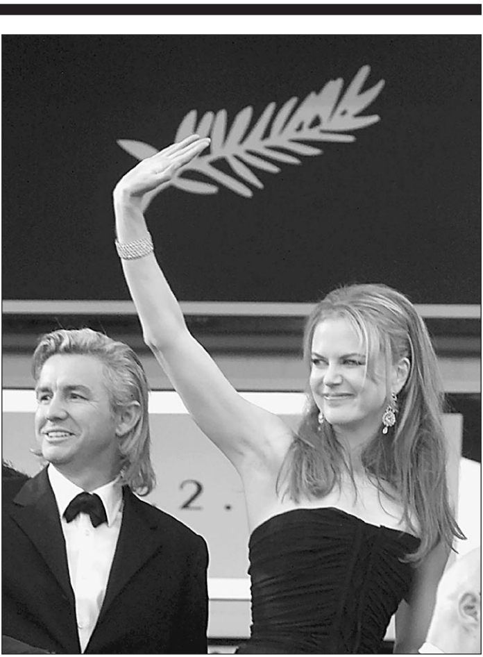
Баз Лурмен и Николь Кидман открыли 54-й Каннский кинофестиваль

А в ночь со среды на четверг в поселке Спасский Нижегородской области в результате пожара, возникшего в двухэтажном двухквартирном доме, погибли пять человек. Как сообщили «Известиям» в МЧС России, возгорание произошло из-за неосторожного обращения с огнем.