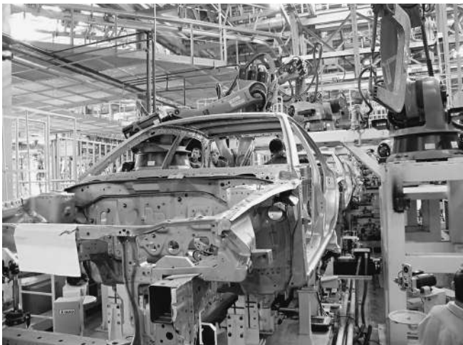
Попытка банкротства «ИжАвто» — главное обвинение в адрес группы СОК