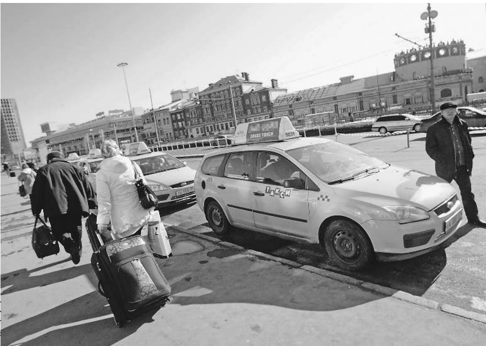
Решив стандартизировать региональные законодательства, власти столкнулись с таким разнообразием правил, что принятие нового закона о такси пришлось перенести