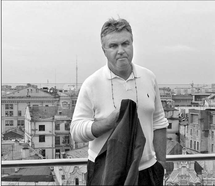
Вчера. Москва. Гус ХИДДИНК.

- Получается, вы вновь сыграете против ван Бастена через месяц после того, как обыграли руководимую им сборную Голландии на Еуро?