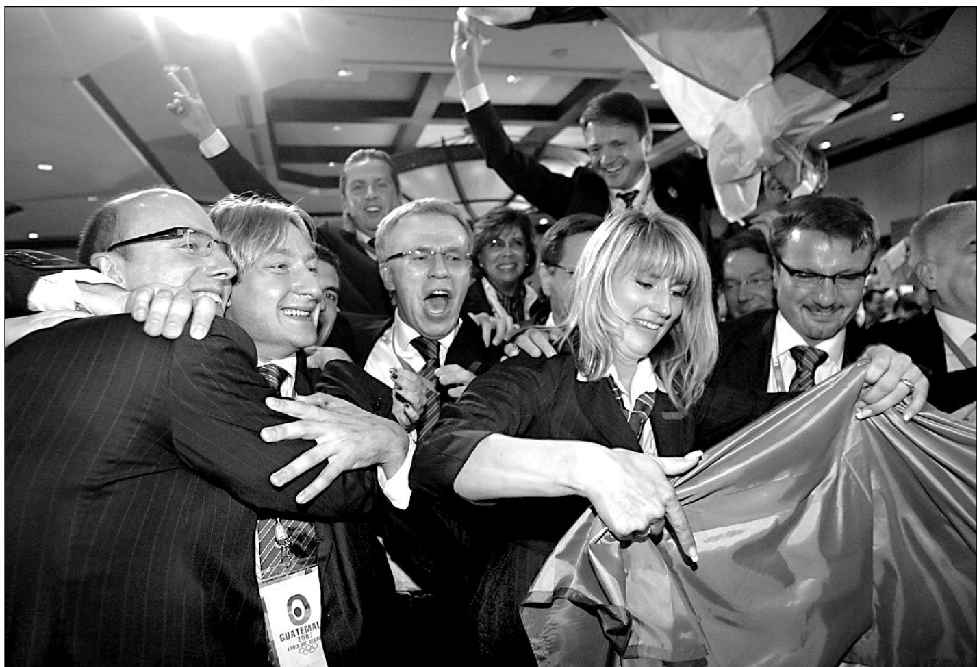
Вчера, Гватемала-сити. Победу празднуют Дмитрий ЧЕРНЫШЕНКО, Евгений ПЛЮЩЕНКО, Вячеслав ФЕТИСОВ, Ирина РОДНИНА, Александр ТКАЧЕВ, Светлана ЖУРОВА, Герман ГРЕФ и их коллеги по российской делегации.