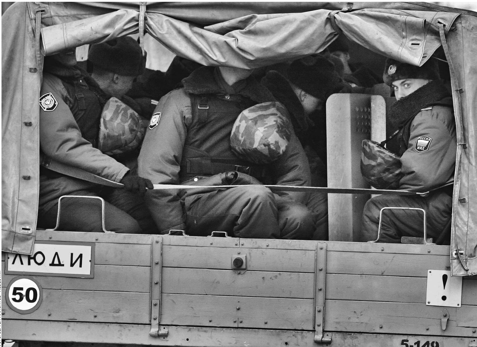
С завтрашнего дня этих ребят будут называть полицейскими. В их жизни многое изменится

Министр внутренних дел Рашид Нургалиев — «Известиям» о том, как будут работать его подчиненные в переходный период