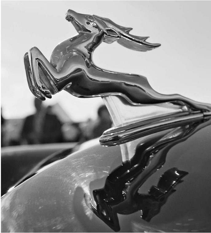
«Волга» для россиян — бренд XX века

«Группа «ГАЗ» не собирается отказываться от легендарного бренда «Волга», но линии, на которых собиралась Volga Siber, будут выпускать автомобили Volkswagen и Skoda. Возможно, «Волгами» станут легкие коммерческие грузовики. Именно на этот сегмент рынка делает ставку президент «Группы «ГАЗ» Бу Андерсен. →04