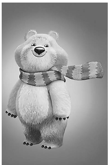
Всего финалистов было десять