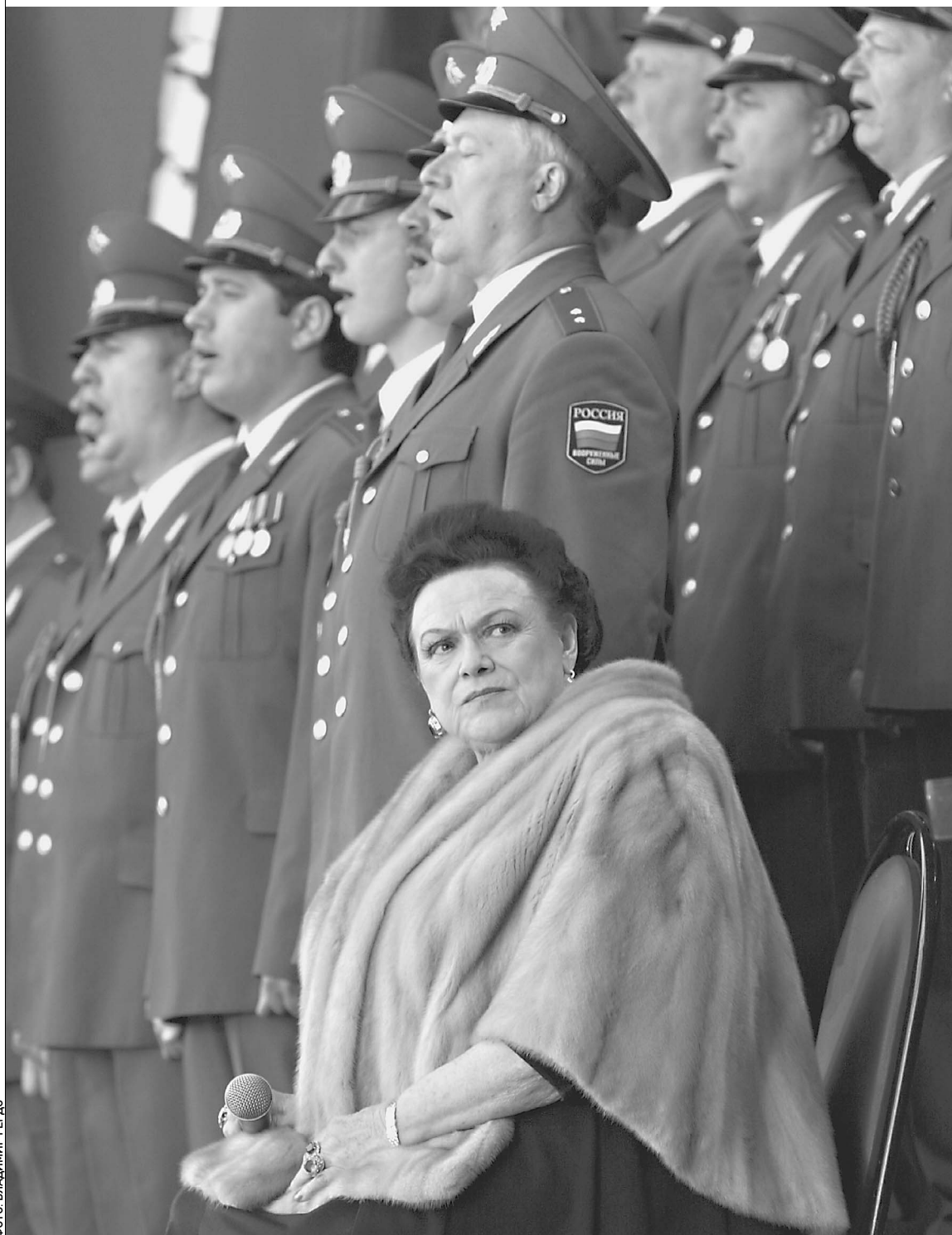
10 июня 2004 года. Людмила Зыкина и хор имени Александрова

В разгар первого июльского дня в реанимационном отделении 83-й московской больницы скончалась народная певица Советского Союза Людмила Зыкина