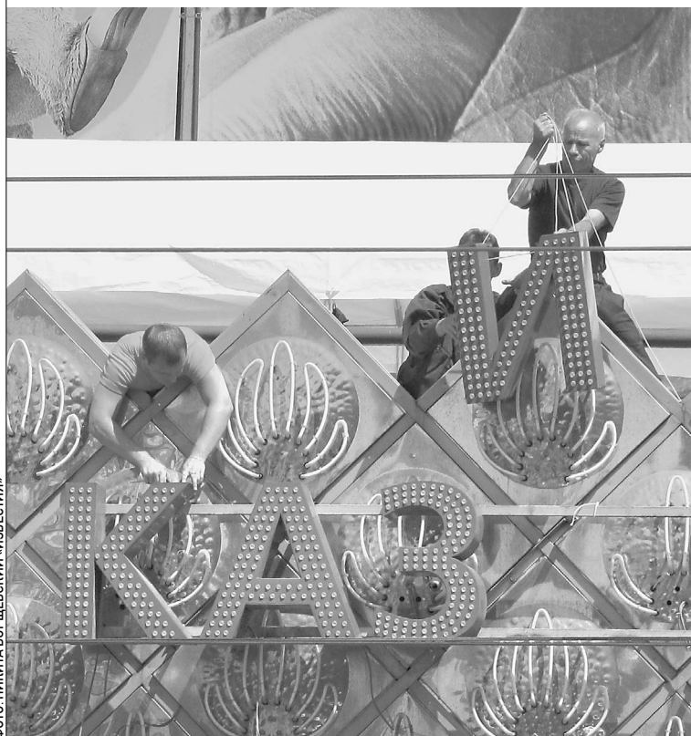
Казино «Шангрила», 10 лет служившее фоном для знаменитого памятника А.С. Пушкину в Москве, закрылось. Навсегда?

Посетители казино «Пекин» надеялись, что ровно в 24.00 рулетка торжественно остановится и владельцы казино поднесут своим верным «дойным коровам» по бокалу хорошего шампанского вместо обычной сладковато-теплой бурды. → стр. 4