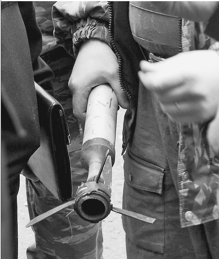
От пожара начали разлетаться неуправляемые снаряды