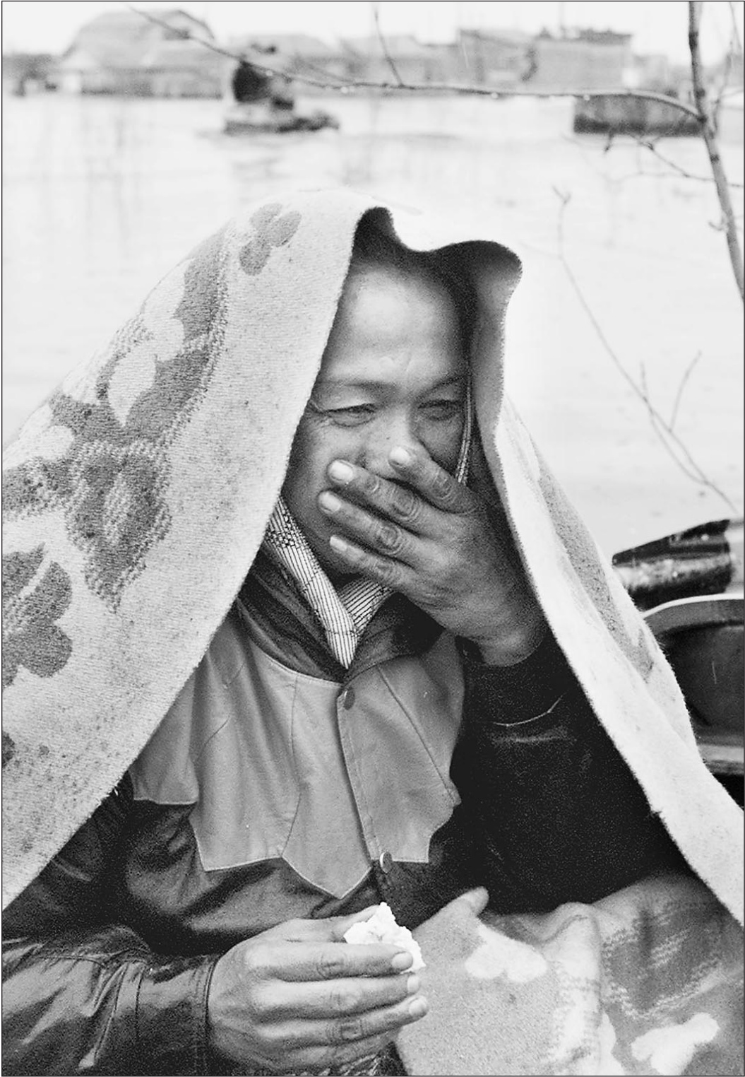
Якутская женщина не боится ни зимы, ни весны

Вчера главе МЧС Сергею Шойгу исполнилось 46 лет. Вчера же в Якутске, столице Республики Саха (Якутия), прорвало дамбу: власти республики оценивают ущерб, причиненный паводком, более чем в 6 миллиардов рублей — такого наводнения здесь не было уже 100 лет. В течение всего дня в Якутске шла лихорадочная подготовка к нашествию огромной массы воды, несущейся по Лене, несколько дней назад этот паводок уже уничтожил город Ленск. На место ЧП уже вылетел корреспондент «Известий».