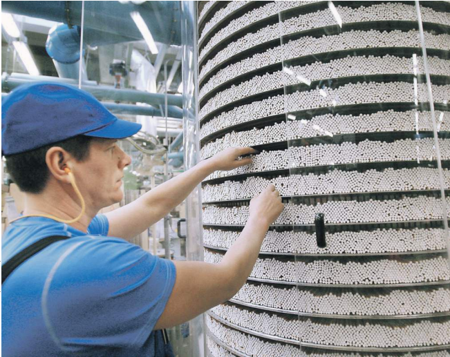
Лет через двадцать табак в России может быть полностью запрещен