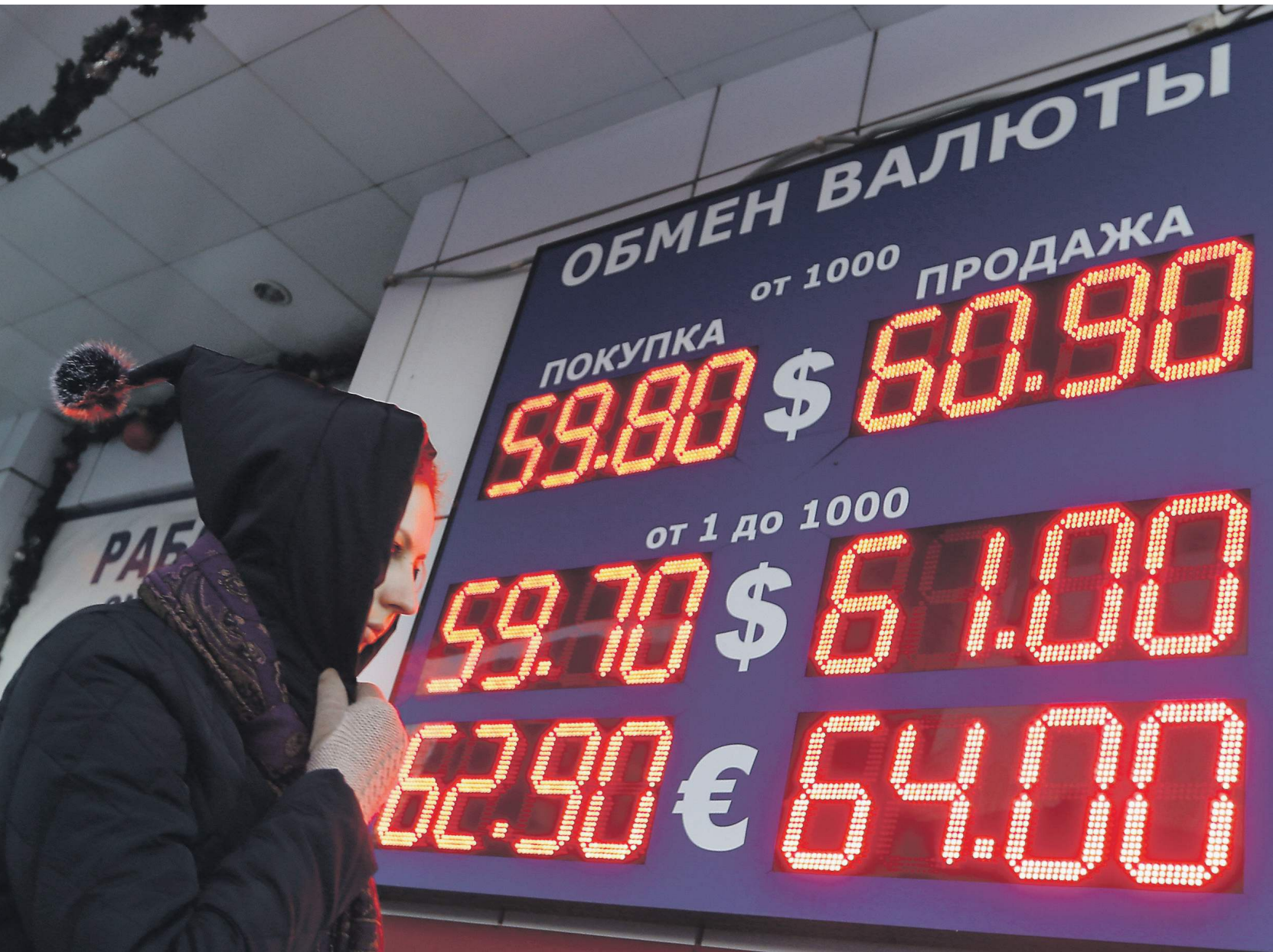
Эксперты ожидают, что в ближайшие месяцы рубль еще больше укрепится

Укрепление российской валюты говорит о позитивных настроениях трейдеров и о привлекательности рубля, со-