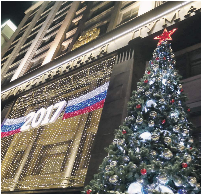
Одна из ключевых задач Думы — поддержка гражданской активности и волонтерской деятельности