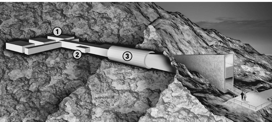
1. Помещение для хранения семян 2. Административный и операционный отсек 3. Рукав, защищающий хранилище от климатических и геологических катаклизмов

Людмила Бутузова Боровский район, Калужская область