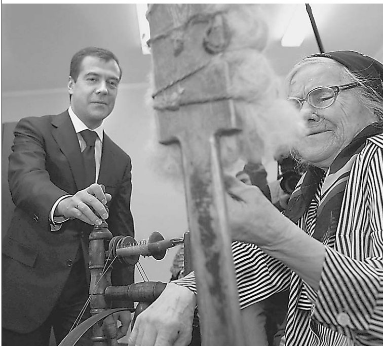
В уфимском доме престарелых Дмитрию Медведеву связали носки из пряжи собственного производства

В библиотеке тем временем уже все было готово к чаепитию, возле каждой чашки стояло блюдце с медом. → стр. 2