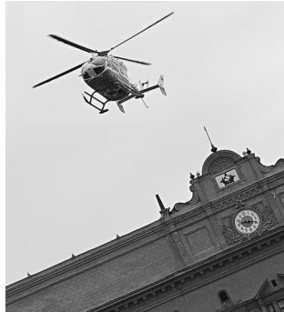
Внешний вид исторического здания обещают сохранить