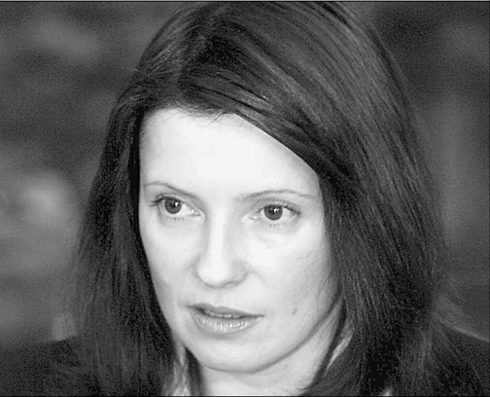
Юлия Тимошенко вновь на свободе Интервью «Известиям»