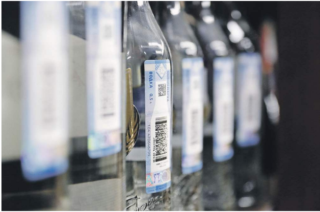
Все собранные акцизы предлагается перечислять сначала в федеральный бюджет

Минфин предлагает новую схему перераспределения отчислений от алкоголя в бюджеты разных уровней