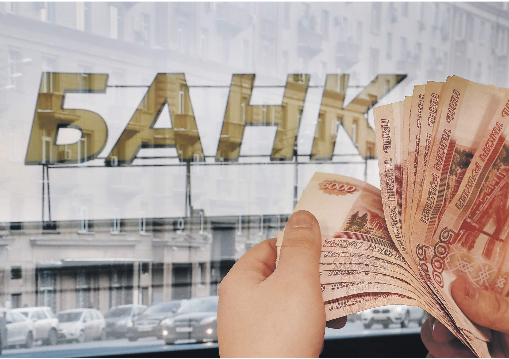
Главным источником роста прибыли в этом году будет сокращение расходов на резервирование потерь по кредитам

Правда, причина таких ожиданий кроется не столько в росте кредитования экономики, сколько в более низких отчислениях в резервы, признают эксперты.