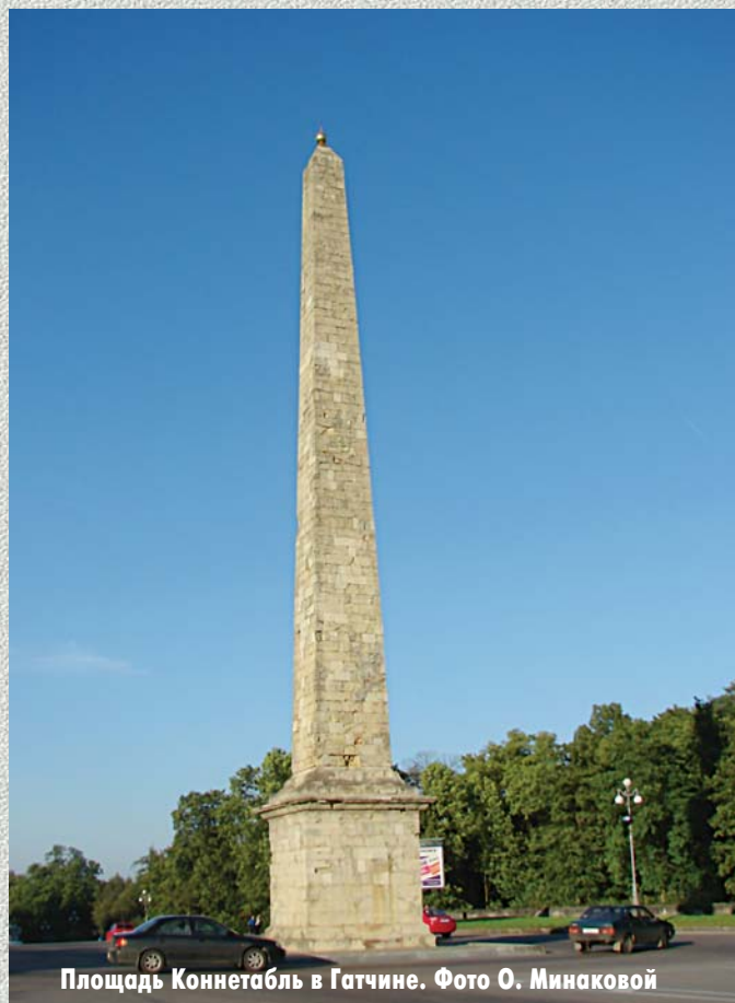
Площадь Коннетабль в Гатчине.