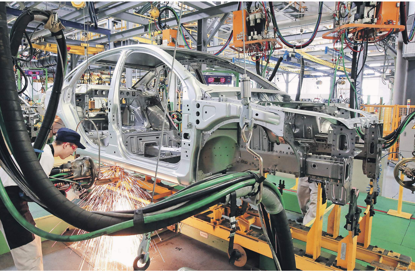
Модернизация предприятий значительно увеличит эффективность производства

— Производительность труда имеет два компонента: организационный и технологический. Организацион-