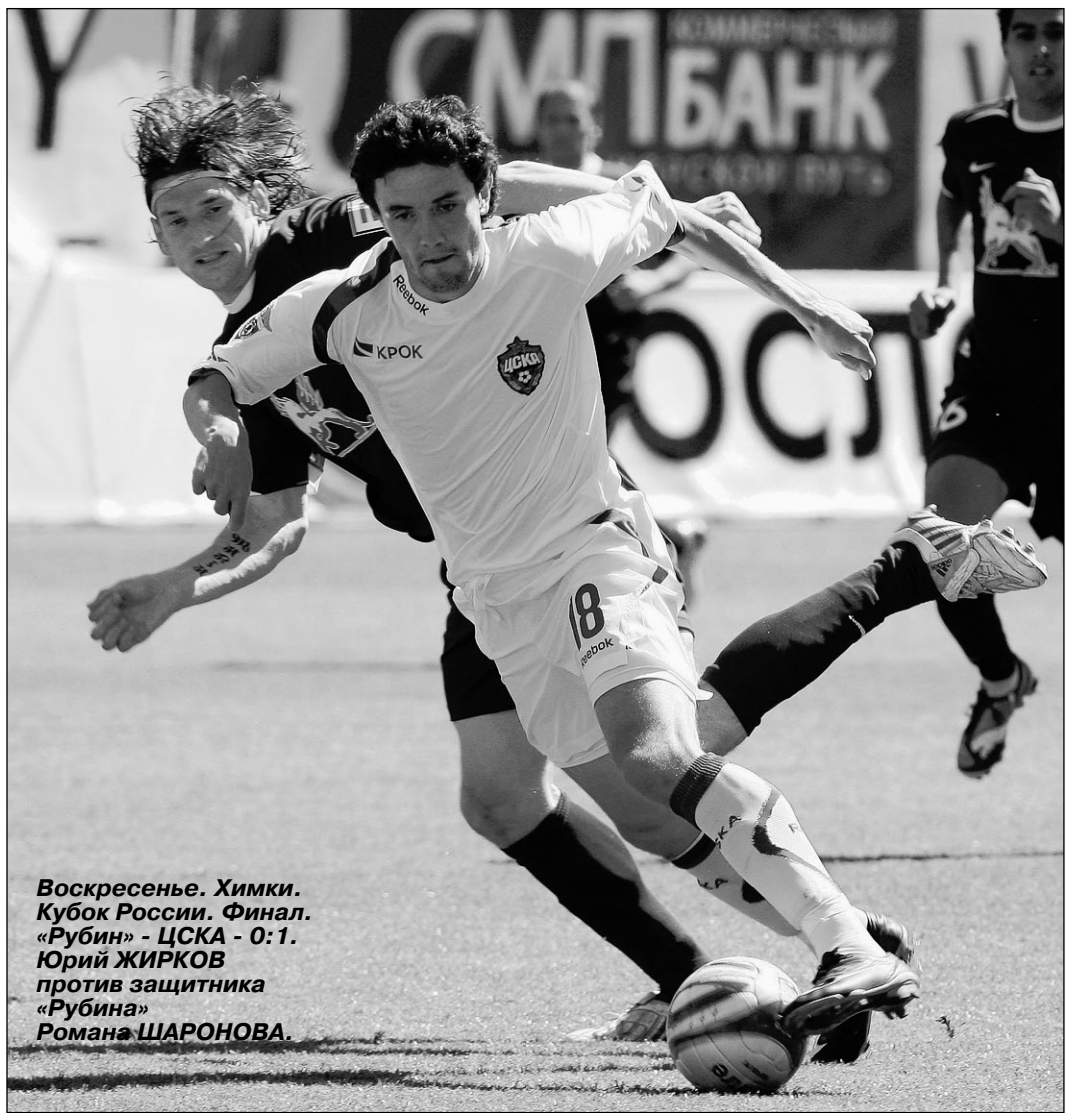
Воскресенье. Химки. Кубок России. Финал. «Рубин» - ЦСКА - 0:1. Юрий ЖИРКОВ против защитника «Рубина» Романа ШАРОНОВА.

Сегодня игроки российской сборной соберутся в Москве, чтобы начать подготовку к отборочному матчу ЧМ-2010 против финнов. Перед отъездом в сборную интервью корреспонденту «СЭ» дал один из ее лидеров.