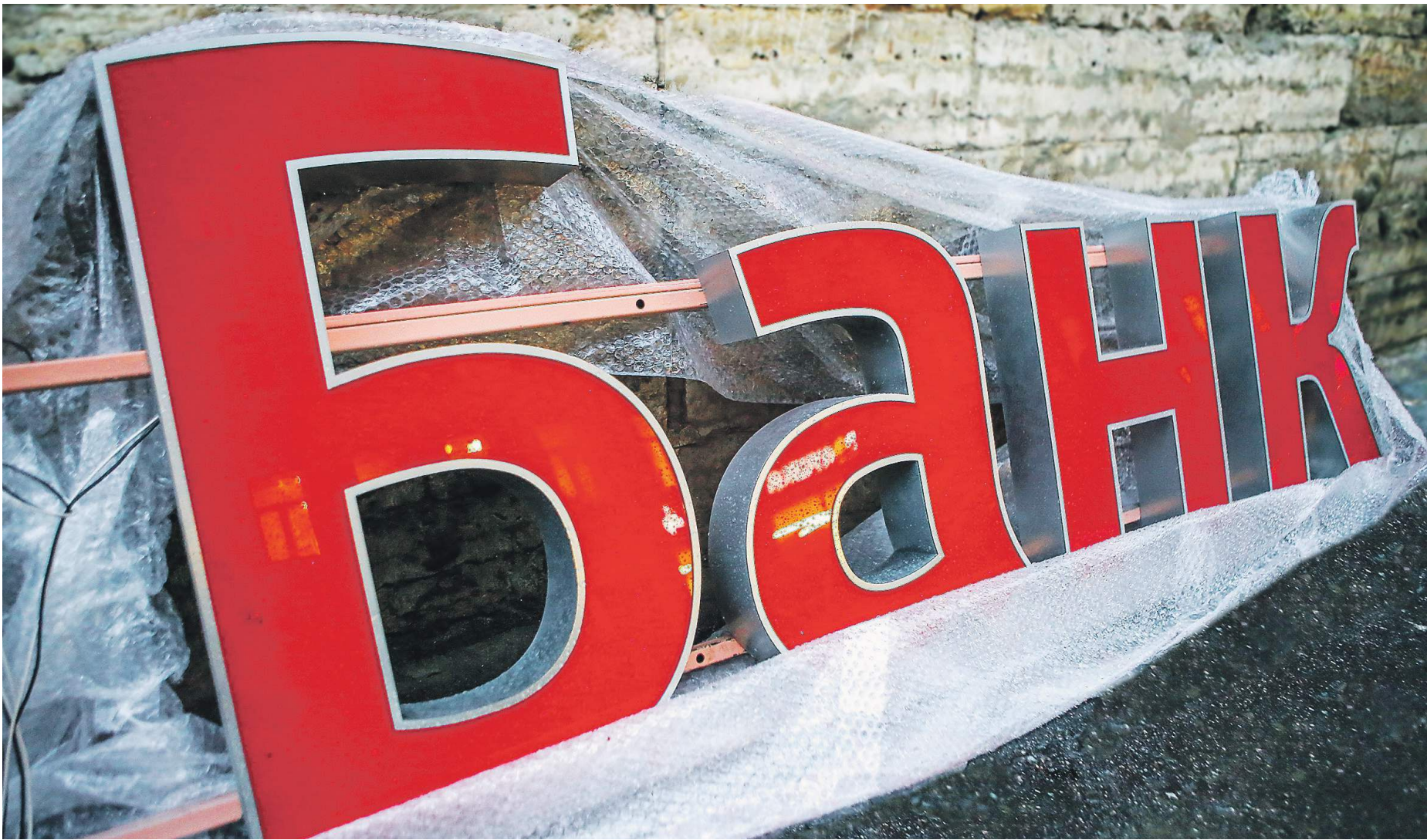
Сейчас банки несут ответственность только в пределах уставного капитала

В Госдуме готовят законопроект, ужесточающий требования к владельцам кредитных организаций