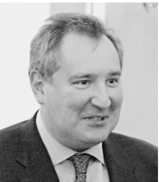
Дмитрий Rogozin знает, где искать сторонников