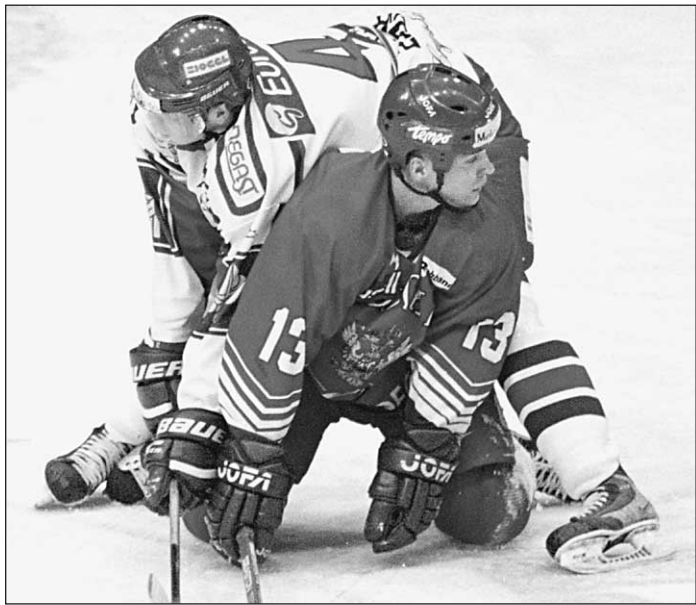
В Германии сборная России поднимется с колен

Тем не менее «уголовное» решение научных проблем способно формировать отношение нации к науке — это мировой опыт, в том числе и наш, не раз подтверждал. Парадокс в том, что в тот же день, когда законопроект был внесен в конгресс, журнал Science сообщил о двух выдающихся достижениях американских научных центров: в одном из них из стволовых клеток эмбрионов «вырастили» клетки, продуцирующие инсулин. Во втором — добились успеха в пересадке клонированных клеток при болезни Паркинсона. Но все это — на мышах. На людях эти эксперименты запрещены законом. И когда будут разрешены — неизвестно.