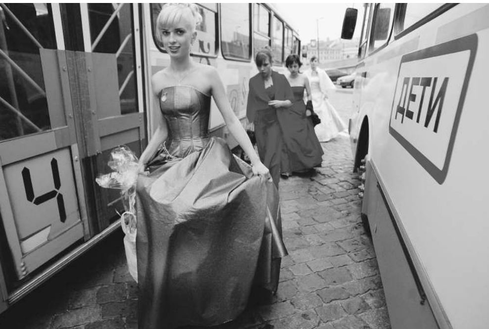
Возможность стать абитуриентами еще до выпускного бала открывает школьникам новые перспективы