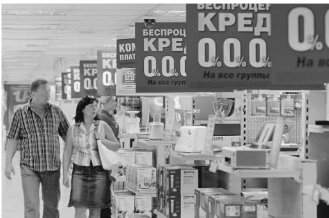
Привлекательные цифры рекламы порой оборачиваются долгой кабалой