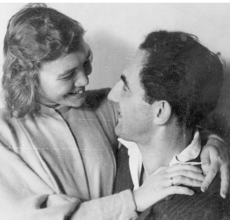
Фото из семейного архива Гинзбургов. Конец 1940-х

На 94-м году жизни умер выдающийся ученый Виталий Гинзбург. Лауреат Нобелевской премии и старейший, с 1953 года, член Российской академии наук. Вклад Гинзбурга в науку неоценим — от фундаментальных открытий в области сверхпроводимости и сверхтекучести до практических предложений, в результате которых была создана водородная бомба. Среди учеников Гинзбурга многие стали академиками. Но не менее важно то, что Виталий Лазаревич Гинзбург был, наверное, последним ученым, который, не занимая никаких постов, имел столь высокий нравственный авторитет, что к его мнению по общественно важным вопросам прислушивались люди всех сословий и состояний. Он не был конформистом — он говорил то, что считал нужным. Его суждения часто шли наперекор официальной позиции, но его это не останавливало. При всей ясности этого жизненного алгоритма в природе человеческой он является великой редкостью. И это было главным открытием Гинзбурга. → стр. 4