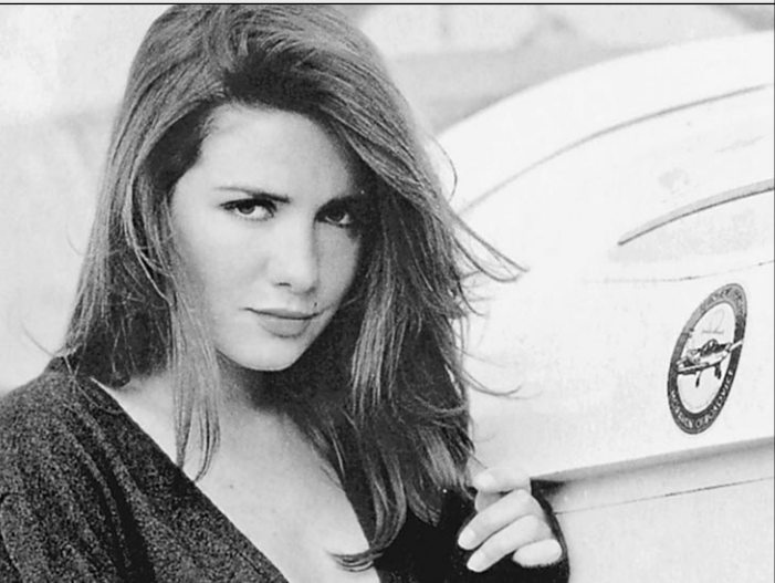
Певца и актриса Наталия Орейро — одно из множества лиц MTV