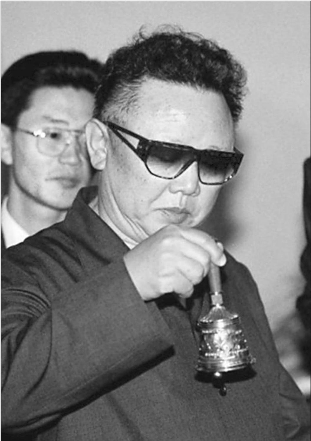
Однозначно гремит колокольчик