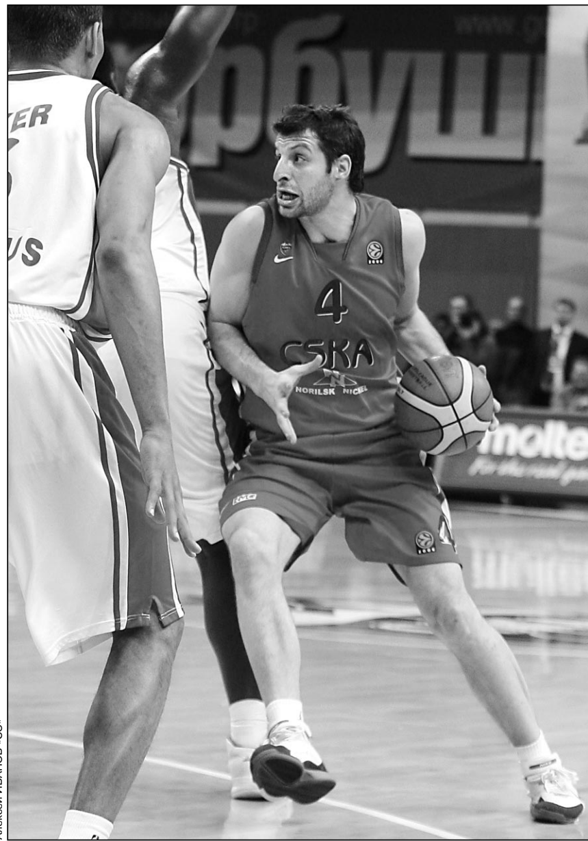
Средня. Москва. ЦСКА - «Олимпиакос» - 83:79. Теодорос ПАПАЛУКАС (№ 4) - лучший баскетболист Европы 2006 года и, видимо, самый дорогостоящий из звезд ЦСКА. Греческий суперразыгрывающий, четыре года назад перешедший в армейский клуб как раз из «Олимпиакоса», не горит желанием ни возвращаться в родную Элладу, ни уезжать из Москвы в НБА.

Если у них получится, нас ждет парад открытых бюджетов. Давно пора.