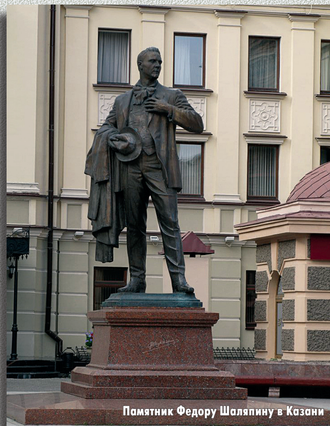
Памятник Федору Шалыпину в Казани