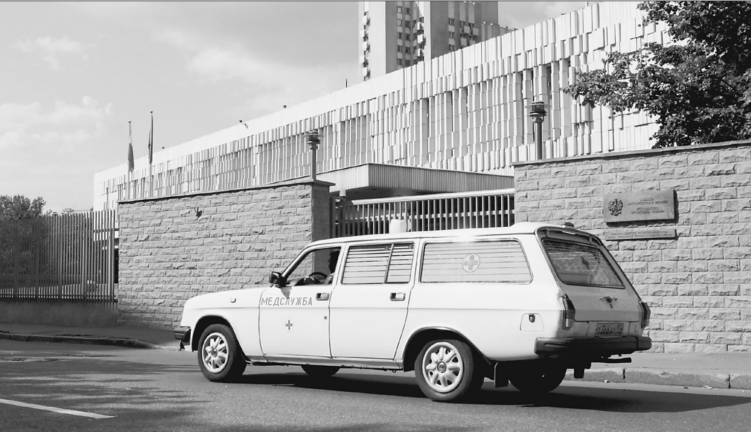
В шестидесяти метрах от этого здания у сотрудника польского посольства неизвестные попросили прикурить