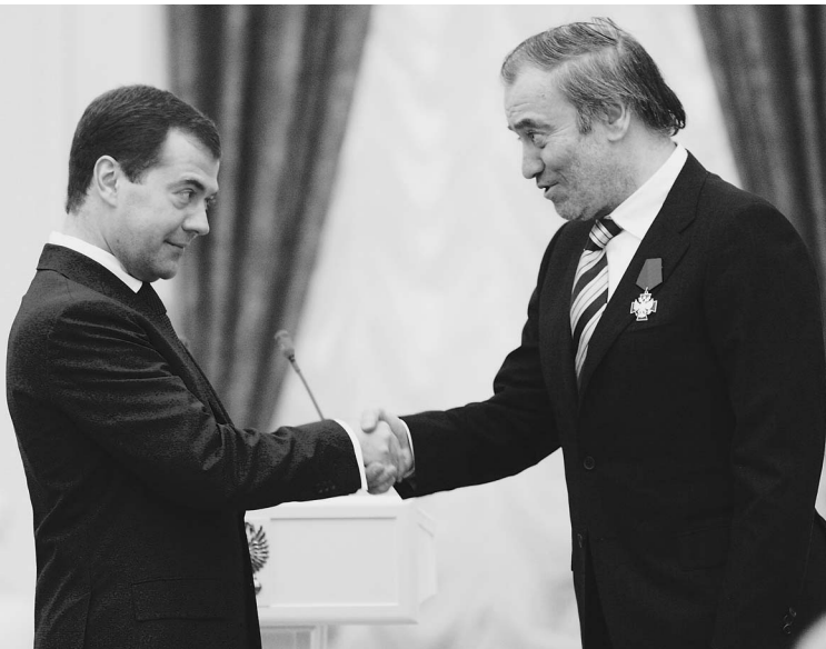
Вчера в Кремле президент России ДМИТРИЙ МЕДВЕДЕВ вручил ВАЛЕРИЮ ГЕРГИЕВУ орден «За заслуги перед Отечеством» IV степени

сящи. Но все-таки в мире мало значительных театров с такой биографией. А если вспомнить, что происходило на сцене Мариинского театра, какие события были им инициированы, скольким мир и Россия обязаны этому театру... → стр. 10