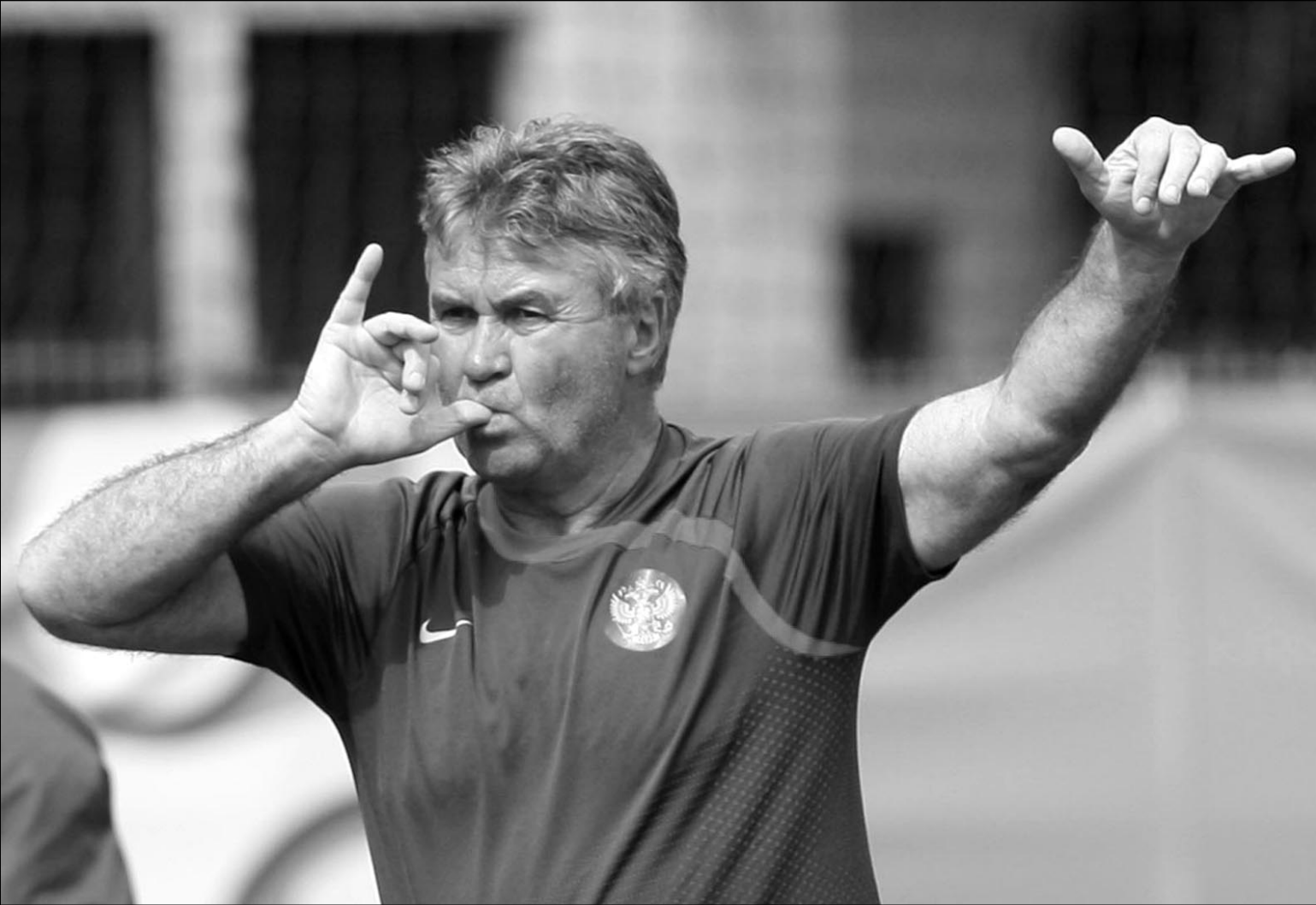
Вчера. Леоганг. Тренировкой сборной России руководит Гус ХИДДИНК, который «плавал, знает, и относительный порядок в нашем трюме наведет».

У нас же в авоське два «трофея»: штанга Зырянова и перекладина Павлюченко. Конечно, это наши, фирменные трофеи. Вроде как расейские грибы грузди: места в лукошке занимают много, а без засолки в рот не возьмешь. Но где грузди - там и белые, нам ли не знать! Главное, в лес выйти, жизнь потом подкажет, вызывать «скорую» или нет. Греческие же грибки из подвез-