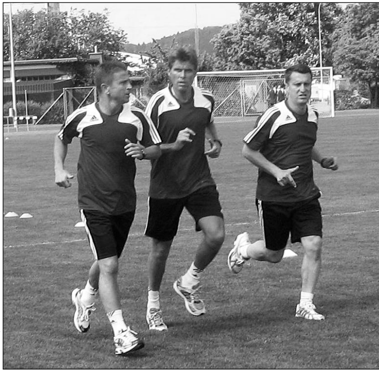
Вчера. Регенсдорф. Главный арбитр матча Греция - Россия Роберто РОЗЕТТИ (в центре) со своими помощниками.

Остается надеяться, что на сей раз россияне выиграют при судействе Розетти и у нас его не будут почитать ляхом, как делают сейчас в Швейцарии.