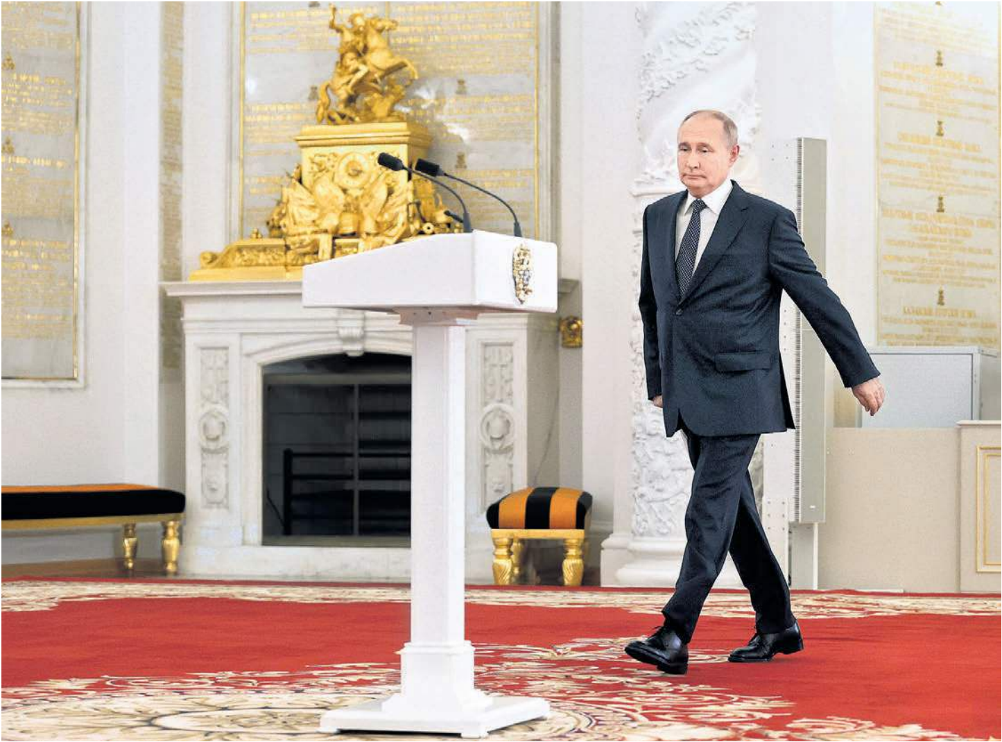
Верховный главнокомандующий не мог отказать себе в выправке

— Через несколько дней, — рассказывал Верховный главнокомандующий, — мы будем отмечать значимую, памятную дату — 80-летие освобождения Белоруссии от нацистских захватчиков. Недавно говорили об этом с президентом Белоруссии (то есть сразу понятно, на что ушла одна из их ночей в Минске. — А. К.). Вы знаете, что эта дерзкая, масштабная операция называлась «Багратион» — в честь нашего выдающегося полководца, героя суворовских походов и Отечественной войны 1812 года. Советские войска действовали дерзко и профессионально, наступали стреми-