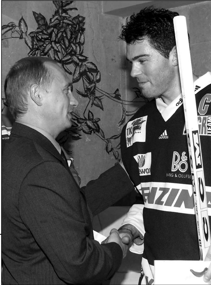
Интервью с Ягром - стр. 8

14 августа 2001 года. Во время приезда Яромира ЯГРА в Москву состоялась его встреча с президентом России Владимиром ПУТИНЫМ.