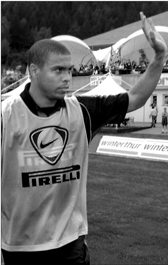
Вторник. Бормио. Товарищеский матч миланского «Интера» с любительской командой из этого городка на севере Италии привлек всеобщее внимание благодаря участию в нем залечившего наконец травму бразильца РОНАЛДО.