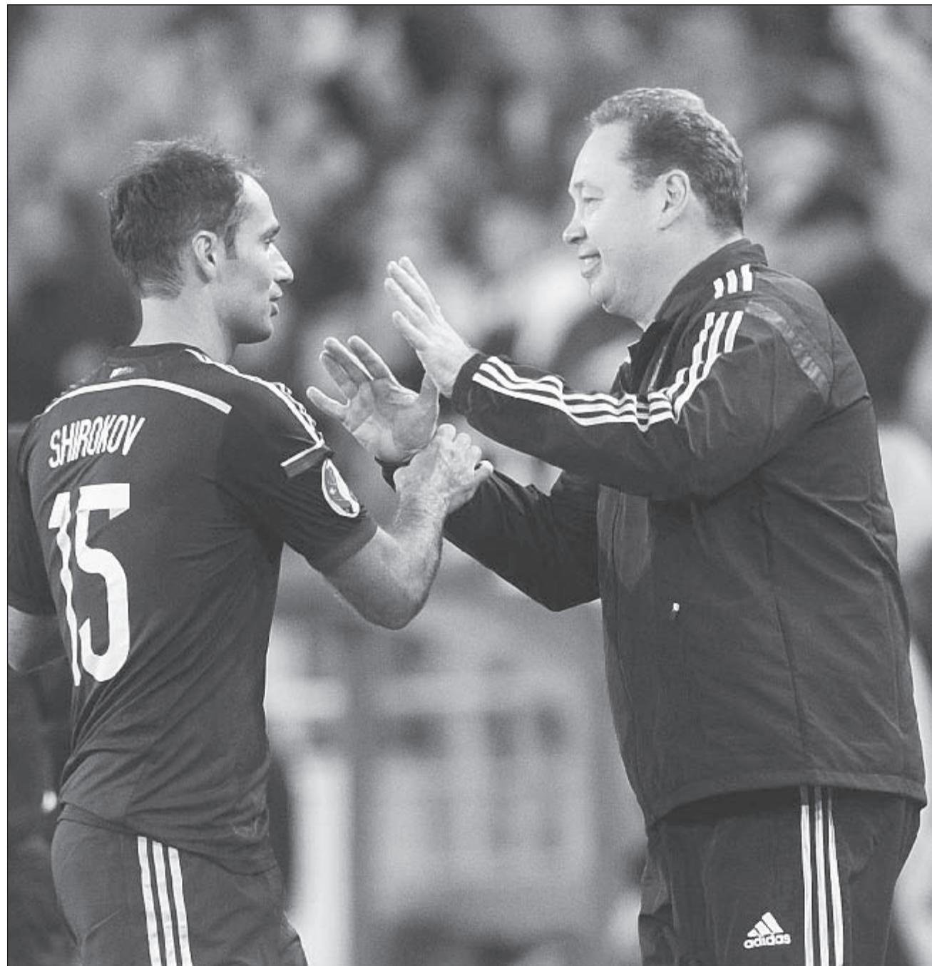
5 сентября 2015 года. Москва. Тушино. Россия - Швеция - 1:0. Роман ШИРОКОВ с главным тренером сборной России Леонидом СЛУЦКИМ.

Обозреватель «СЭ» - о расторжении контракта Романа Широкова со «Спартаком» и будущем капитана сборной России