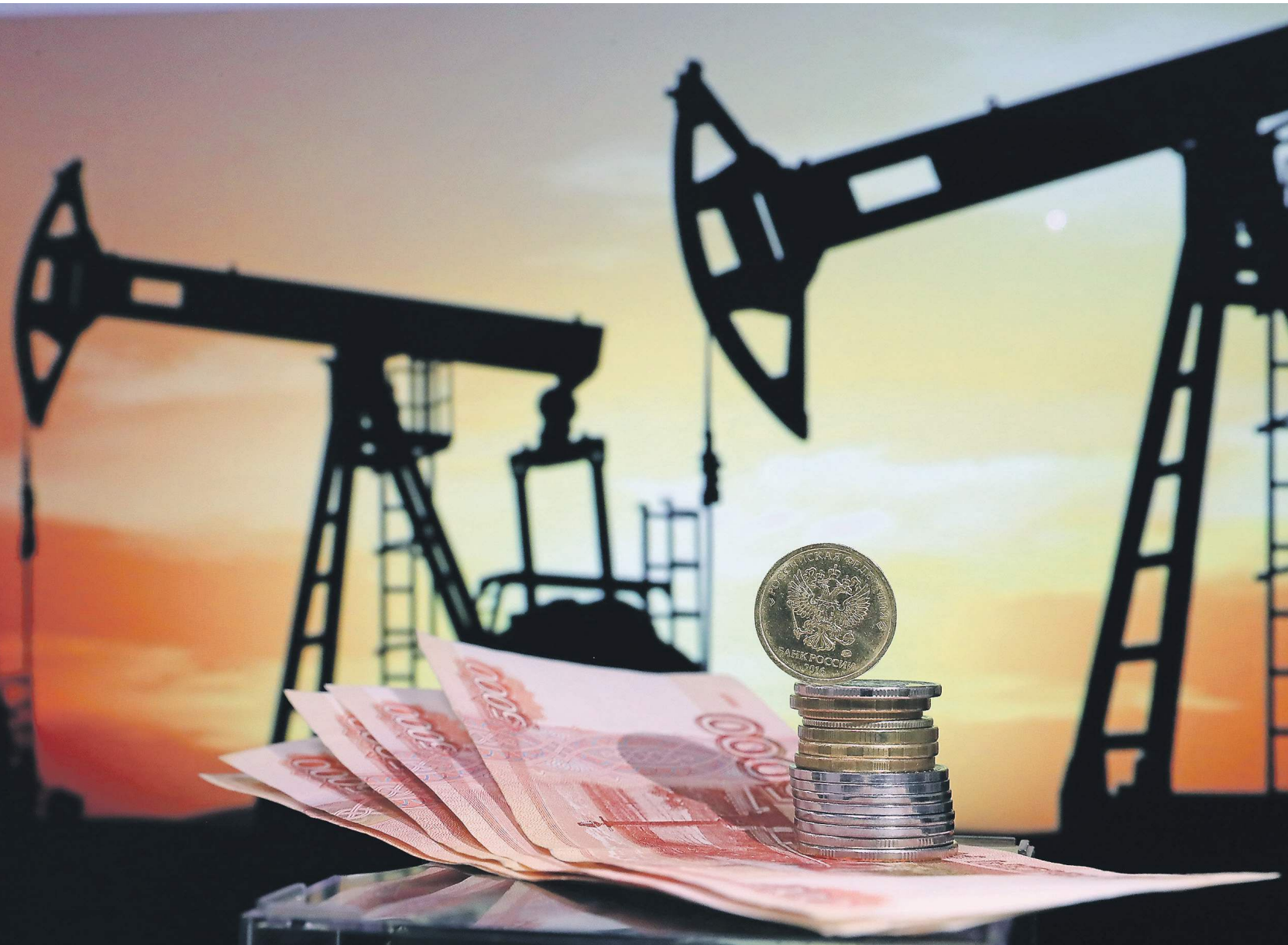
Восстановление цен на нефть создает двойное преимущество для страны, так как она источник и доходов, и иностранной валюты

По его словам, Россия может достаточно успешно управлять