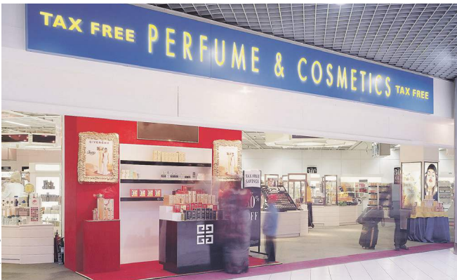
Минпромторг прогнозирует, что рост торгового оборота в результате введения tax free составит 500 млрд рублей