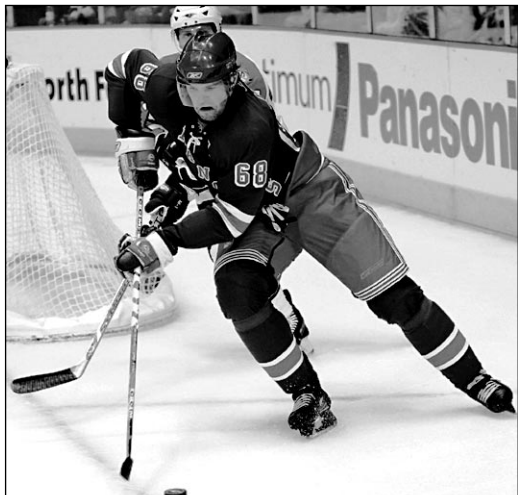
Вчера. Нью-Йорк. «Рейнджерс» - «Флорида» - 5:2. В атаке - Яромир ЯГР.