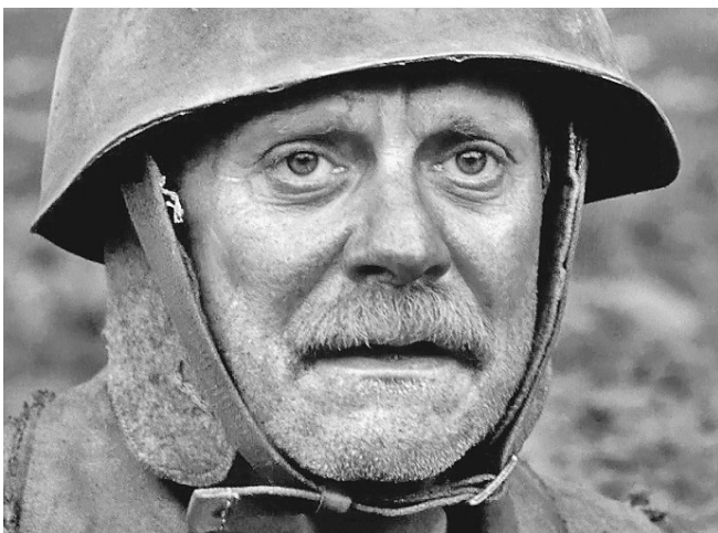
Оскарский комитет оценил окопные страдания режиссера

Впрочем, это не убедило некоторых членов жюри, и, по данным «Известий», решение может быть пересмотрено. Председатель комитета Владимир Меньшов в разговоре с нами отказался комментировать выдвижение «Цитадели», сказав, что ему необходимо время для более четкого понимания происходящего и формулирования своей позиции. Однако, по кулуарной информации, он отказался подписывать протокол заседания и потребовал физическо-