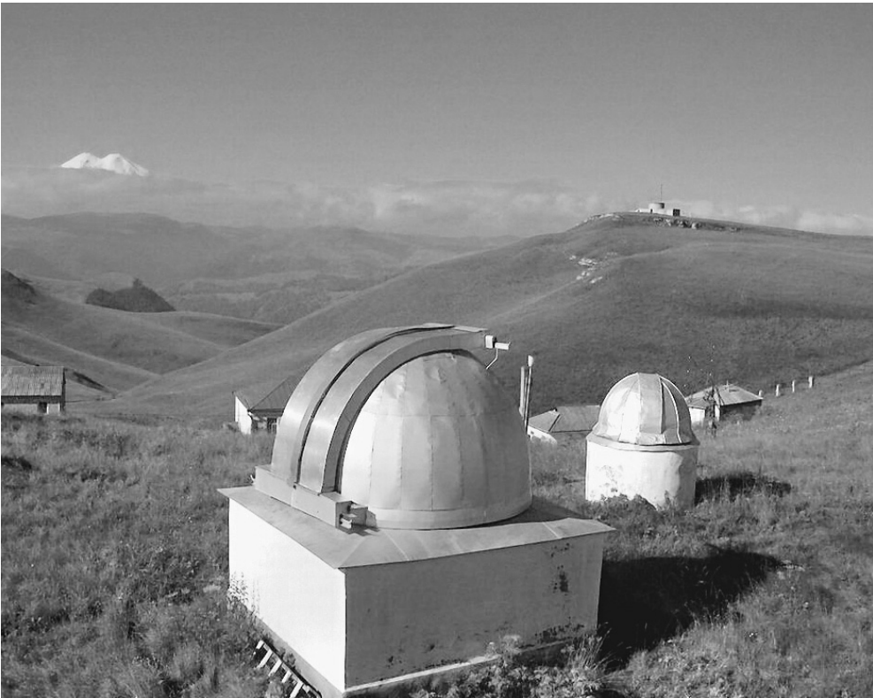
Кисловодская горная станция — главная наблюдательная сила Пулковской обсерватории