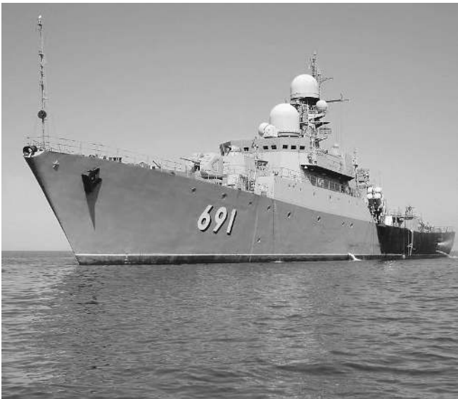
Сторожевик «Татарстан» скоро получит брата-близнеца

DJIA 11401.01 ▼ NASDAQ 2612.83 ▼ MMBS 1521.35 ▲ PTC 1530.09 ▲ НЕФТЬ BRENT 110.78 ▲ ЗОЛОТО 1787.60 ▲ РУБЛЬ/€ 42,206 ▲ РУБЛЬ/$ 30,868 ▲