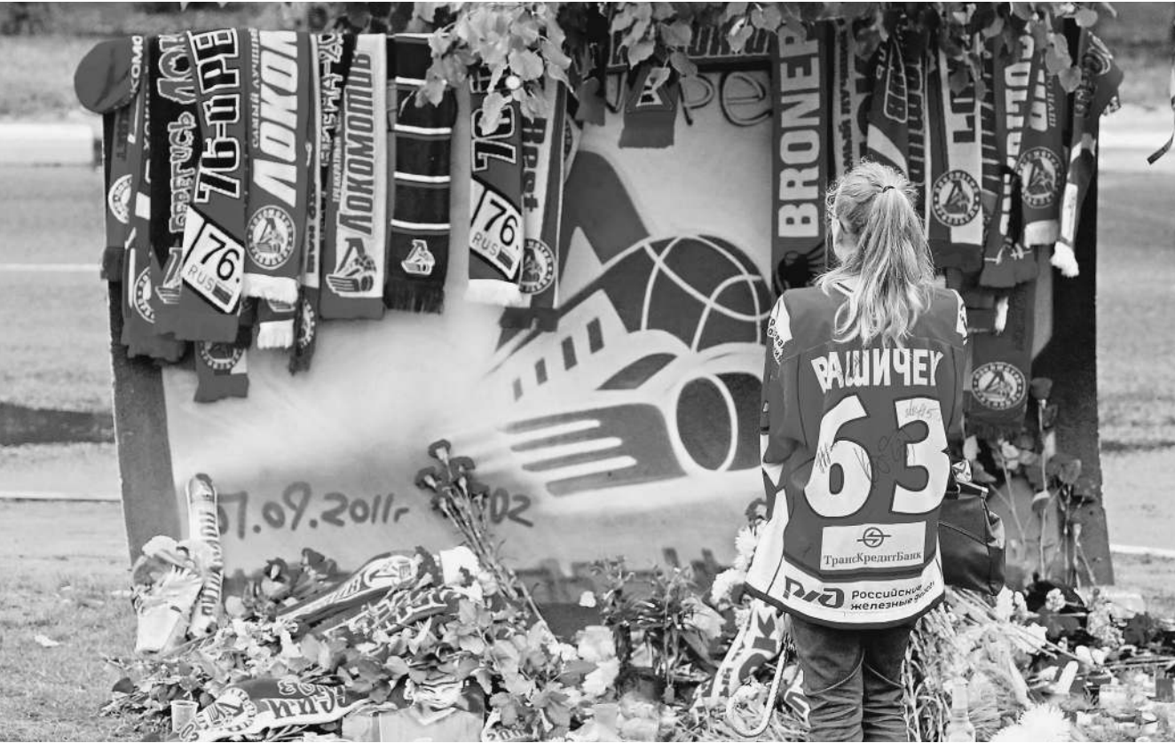
Круглые сутки поклонники несут цветы, шарфы и свечи, руководство страны принимает экстренные меры, чтобы не допустить повторения трагедии, следственные органы ищут виновных, а хоккейное сообщество — выход из ситуации