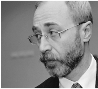
Кроме прочего Лейрих предоставлял партии помещение