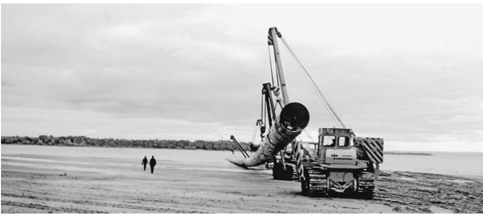
Международные санкции подтолкнули персидский газ в сторону Индостана и далее — в Китай