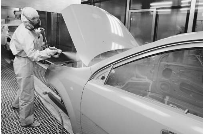
Не всякий цвет может называться олимпийским

Право использовать «олимпийские» обозначения в категории «автомобиль» в России есть лишь у «дочки» Volkswagen —