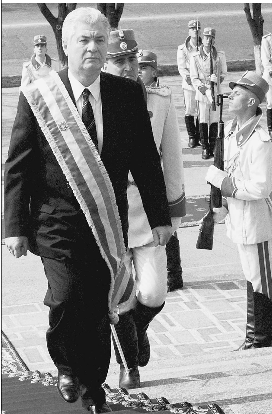
Президент Молдавии Владимир Воронин пытается вести войну на два фронта

В Кишиневе арестованы российские граждане за «политическую контрабанду»