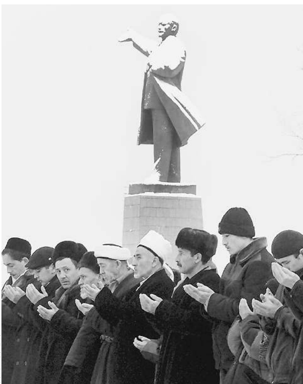
Киргизские парадоксы: правоверные мусульмане перед памятником атеисту Ленину

В целом же обстановка в столице абсолютно мирная. Даже, быть может, несколько сонная. Нет ни пикетов, ни шествий, ни других внешних признаков социального недовольства. Наблюдается обычная го-