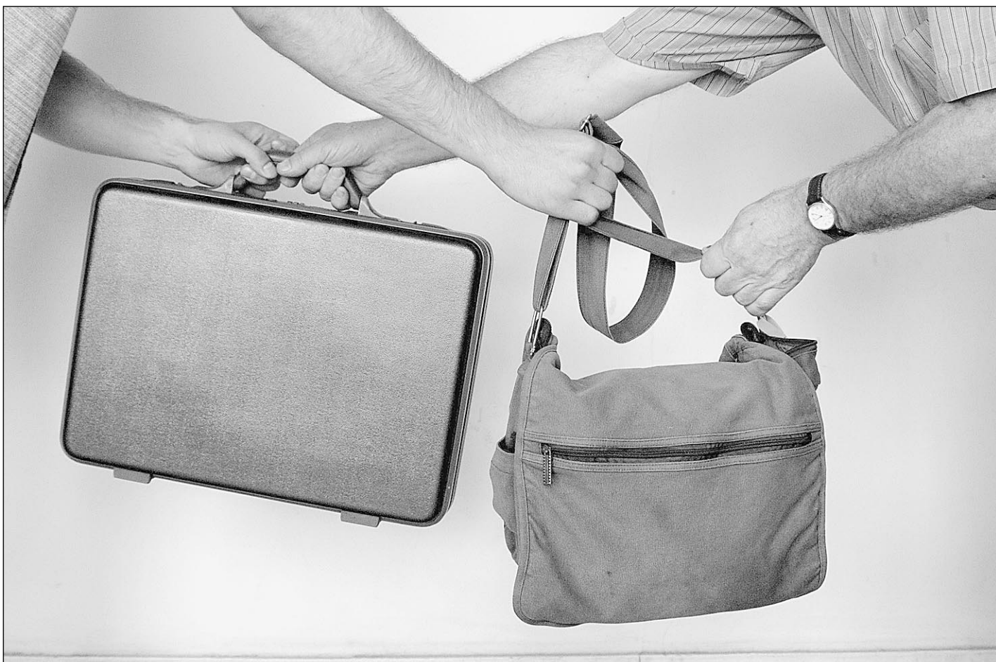
Рыночная экономика победила

В конце августа появилось неведомое русскому уху слово «дефолт». Отказ правительства и Центробанка от обязательств по государственному ценным