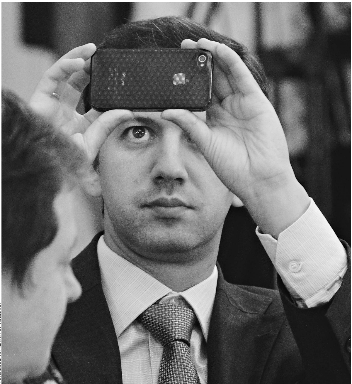
Технологические новинки позволяют АрКАДию Дворковичу поддерживать постоянный контакт с интернет-аудиторией и таким образом улучшать психологический климат в стране

Помощник президента Аркадий Дворкович знает, как привлечь в нашу экономику инвесторов