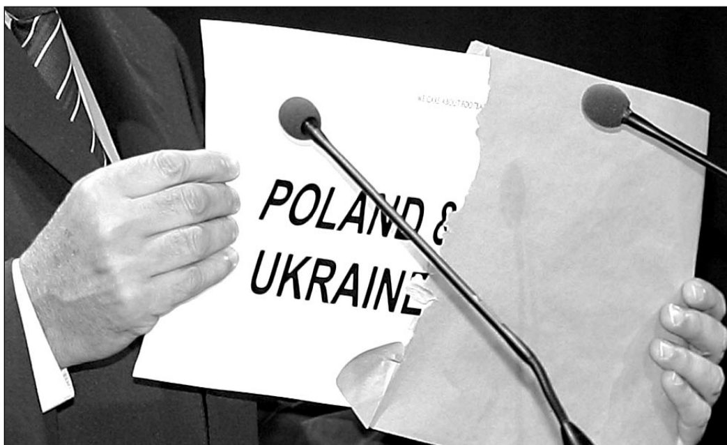
18 апреля 2007 года. Кардифф. Президент УЕФА Мишель Платини вскрывает конверт с названиями стран-победителей гонки за право принять ЧЕ-2012.